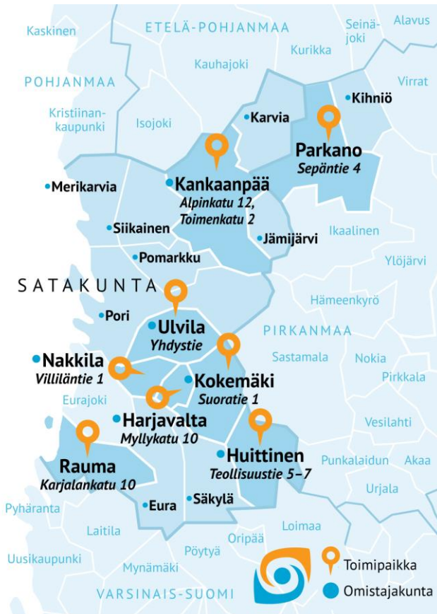
Kuvio 1. Satakunnan koulutuskuntayhtymän jäsenkunnat v. 2023